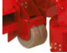
Roues réglables en hauteur