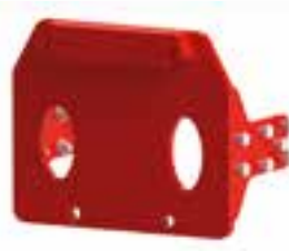
Plaque de montage Ladog (réf. 267.95.471) 390,00 €