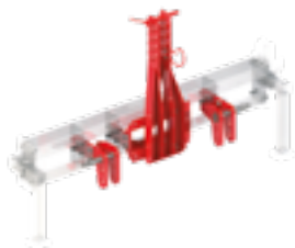
Attelage 3 points cat. I et II (réf. 267.95.288) 560,00 €