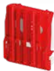
Plaque de montage Multicar M26 (réf. 267.95.469) 390,00 €