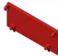
Fixation Euro (réf. 267.95.467) 540,00 €