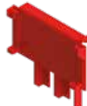
Plaque de montage Avant (réf. 267.95.306) 730,00 €