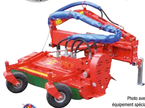
Photo avec équipement spécial

Observez SVP nos informations pratiques de commande page 55