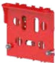
Plaque de montage Hansa (réf. 267.95.468) 390,00 €