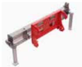
Plaque d'extension Schäffer (réf. 267.95.004) 470,- €