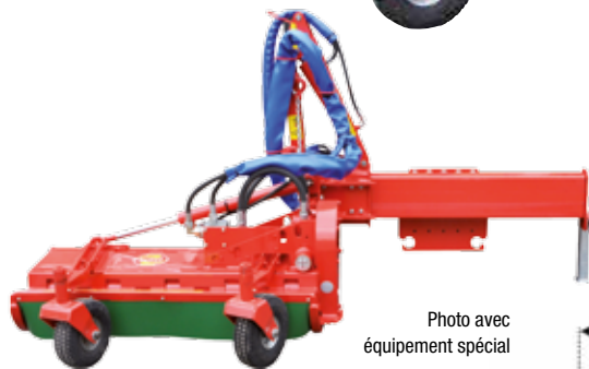
Photo avec équipement spécial

Observez SVP nos informations pratiques de commande page 55