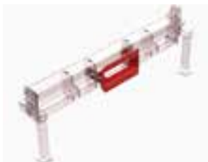
Fixation universelle (réf. 267.95.386) 160,00 €