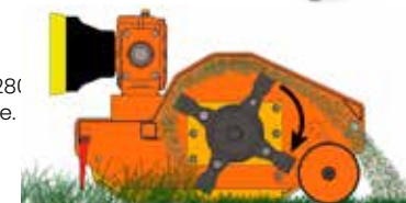
Déchargement du produit coupé derrière le rouleau