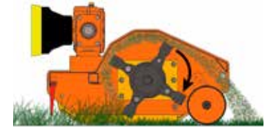
Abladen des gehäckselten Gutes über bzw. hinterhalb der Walze