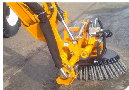
Brosse de désherbage