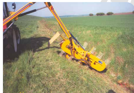
Andaineurs à tapis