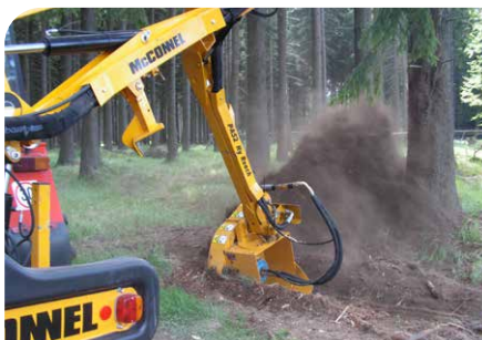
Cureuse de fossés

Puisque nous sommes très attentifs aux besoins de nos clients, nous sommes toujours en mesure de proposer une solution parfaitement adaptée. Si vous ne trouvez pas la solution parfaite dans notre offre standard de marques européennes de grande renommée, nous utilisons notre expérience pour vous apporter une réponse innovante avec notre propre marque, Dabekausen Power. C'est pourquoi il y a une bonne solution pour pratiquement chaque demande.