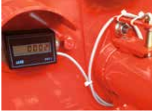
Bedrijfsurenteller (Art.-Nr. 529.95.904)