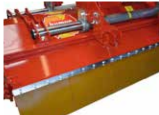
Extra rubberen steenslag-bescherming aan de achterzijde