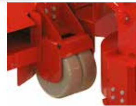
In hoogte verstelbare loopwielen