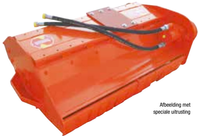
Afbeelding met speciale uitrusting