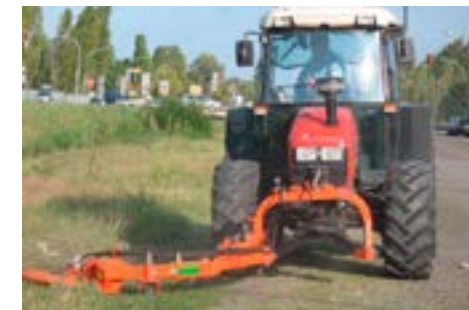
OLIVIA X Front