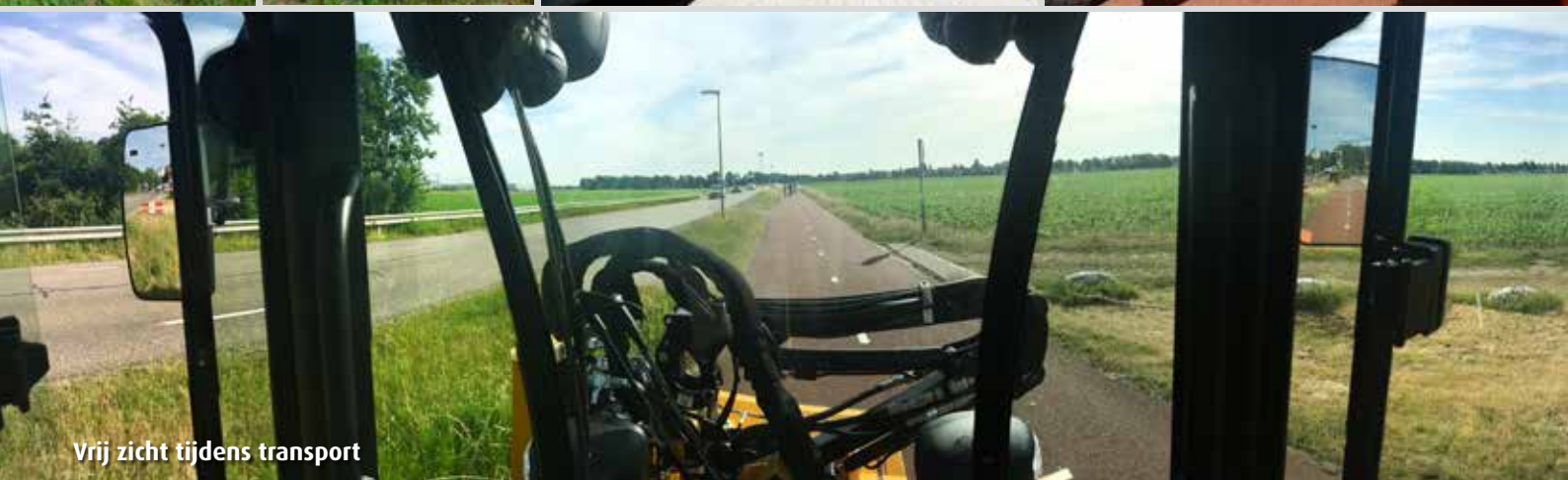
Vrij zicht tijdens transport