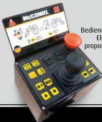
Bediening XTC, Elektrisch proportioneel